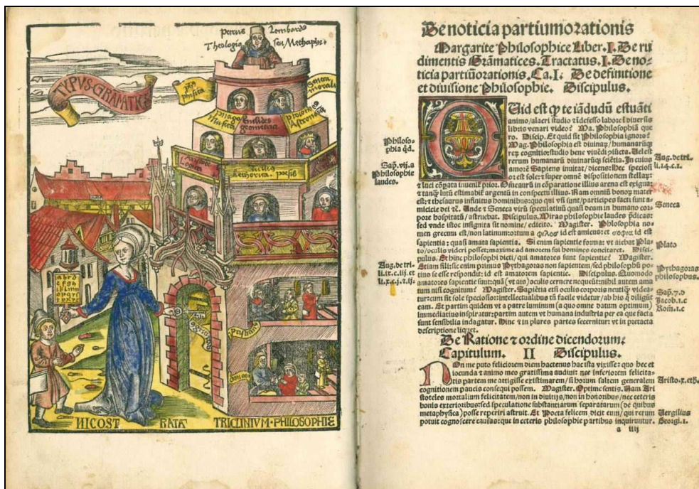
UB Leipzig, Sign.: Allg.Enz.617 = Gregor Reisch: Margarita Philosophica (Perle der Philosophie), Basel 1517. Die Philosophie schließt dem ehemaligen ABC-Schützen das Gebäude der Sieben Freien Künste auf. Oben: Petrus Lombardus (um 1095/1100 bis 1160), Verfasser des vierbändigen Standardwerks: „Sentenzenkommentar“.